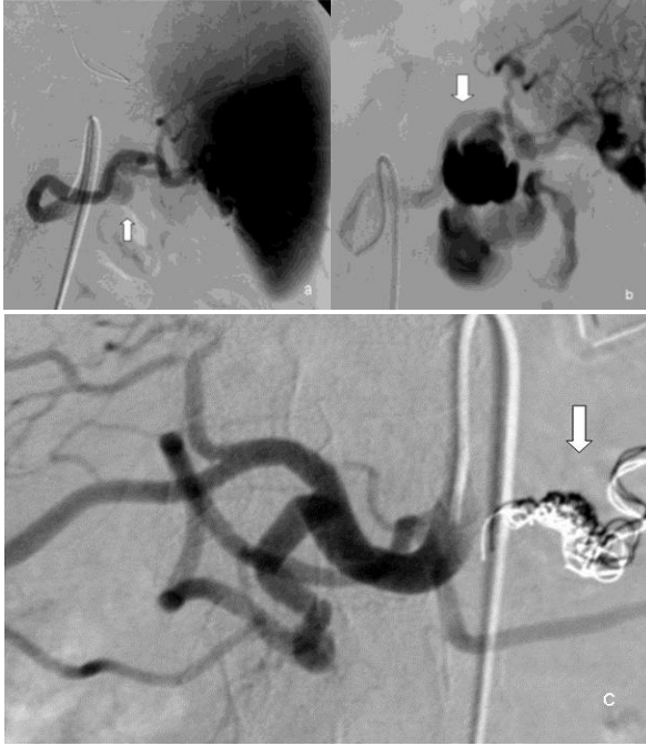
Şekil-2. a. 56 yaşında erkek hastada DSA görüntülerinde akut pankreatit sonrası gelişen pseudoanevrizma izlenmektedir (ok), b. DSA esnasında pseudoanevrizmada rüptür (ok) gelişti, c. koille embolizasyon ile tedavi edildi (ok).