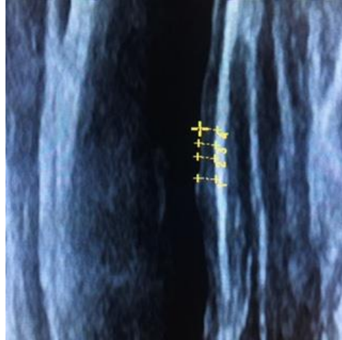
Şekil-2. Karotis intima-media ölçümü.

Subklinik aterosklerozun belirteçleri olan KIMK ve EYK'na ek olarak retinal vasküler hastalıkların OKTA ile girişimsel olmayan yöntemlerle değerlendirmesi, glukoz metabolizması bozukluğu olan hastaların risk değerlendirilmesine katkı sağlayacaktır.