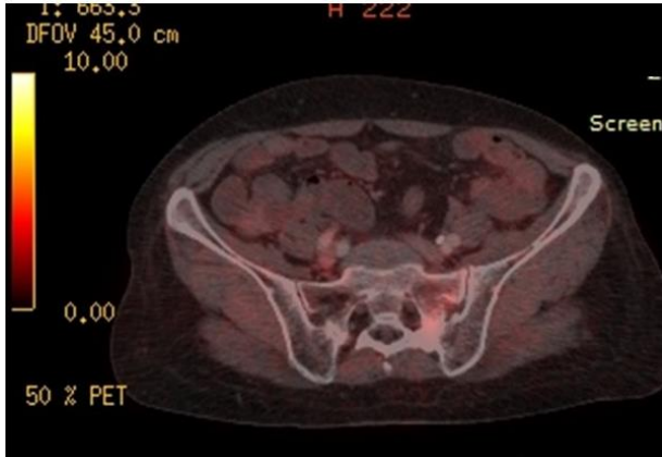
Şekil-4. PET-BT'de sakrum sol yarısındaki fraktür bölgesinde orta derece FDG tutulumu ( SUV_{max} : 2.7).

PET-BT'de, PYK'de diffüz tutulum tipiktir ve malign lezyonlara göre daha düşük FDG tutulumu ( SUV_{max} < 6 ) mevcuttur (Şekil-4). Ancak PET-BT PYK'nin osteoblastik aktivitenin yüksek olduğu erken dönemde çekilirse FDG değerleri daha yüksek olarak saptanabilir. Benzer olarak sakroiliak ekleme paralel, diffüz ve lineer FDG uptake'i PYK için tipiktir. Shin ve ark. (10), 19 malign ve 15 benign fraktür üzerinde yaptığı çalışmanın sonuçlarına göre, benign fraktürlerin 14'ünde kemik iliği tutulumu saptanmazken malign fraktürlerin hepsinde kemik iliği tutulumu bulunmaktadır.