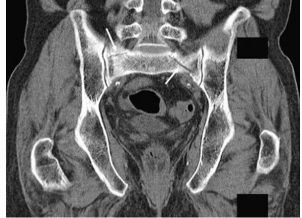
Şekil-1. Bilgisayarlı tomografi görüntülerinde pelvik yetmezlik kırığının kırık hatları (oklar).

BT yüksek duyarlılığa sahiptir. Tanıda, kırık hattının veya sklerotik değişikliklerin gösterilmesi ve trabekülanın geri kalan kısmının intakt olması önemlidir. Tipik PYK, sakroiliak eklemler paralel seyretmektedir. Lineer kırık hatları çevresinde belli belirsiz sklerozis olması PYK için karakteristiktir (Şekil-1) (5).